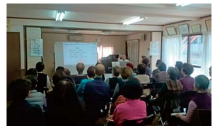
歌声サロンの様様