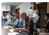
脳トレに真剣に取り組む