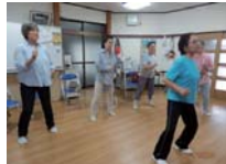
エアロビクス体操