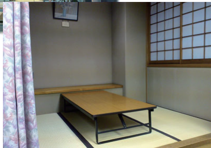
2F 福祉相談コーナー