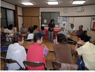
談笑される皆さん

地域の皆様同士でお茶を飲みながら、楽しい時間を過ごしていただこうと綱島地区で初の交流サロンが9月25日開設されました。このサロンは、高齢者同士、地域住民に日常的に交流を深めてもらおうと、「元気でふれあうまち 綱島」を合言葉に、平成24年度から検討を始め、今年度からこれを具体化するために、他地区で同種事業を進めている施設の視察や綱島地区内の候補施設などを探索し、実現の運びとなりました。今年度からスタートした新「ひとつプラン港北」綱島地区計画計画」に基づく第1号の事業です。推進委員会「地域交流部会」では、今後このサロンを地域の皆さんと一緒に定期的な開催を目指してまいります。同時に、綱島西地区においてもこれを拡大し、地域活動への関心を高めてい