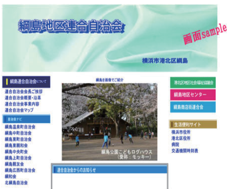
地域情報部会ワーキンググループで画面デザイン・掲載内容を検討中

地域情報部会の活動は、当面、年2回発行のニュースの継続と連合自治会ホームページの立ち上げによる地域情報の提供の仕組み作りです。10月現在、ホームページのトップページをはじめとしてこれから繋がるサブページの計画書の作成が進み、間もなく、来春4月稼働を目標とした制作に取りかかるところまで進んでいます。ホームページのイメージ作りは部会の中に「HP開発WG(ワーキンググループ)」を設けて行っております。これを推進委員会に諮り進めております。今後、地域の皆様や自治会町内会・商店会・各種活動団体などのみなさまには、あらゆる場面で情報提供などについてご提供いただくことがあるかと思っております。是非ともご協力をお願いいたします。