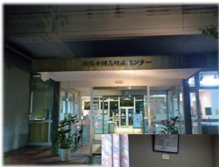
網島地区センター